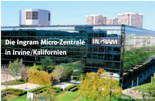
Die Ingram Micro-Zentrale in Irvine/Kalifornien